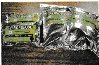
新商品「フラボノフード」

HP ( http://houwa-inc.jp/cgi-bin/main/list.cgi )く。